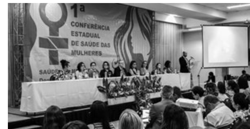
Abertura da 1ª Conferência Estadual de Saúde das Mulheres, realizada no dia 10 de Julho, em Natal.