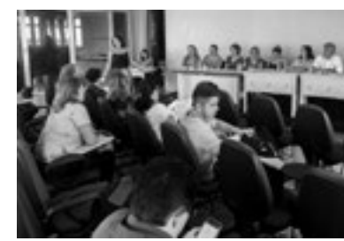
Reunião ordinária da Comissão Intergestores Bipartite (CIB), realizada em 14 de Novembro, em Natal.