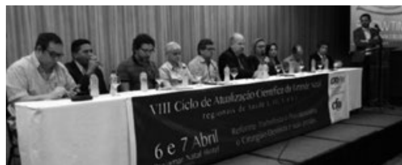
Abertura dos trabalhos do VIII Ciclo de Atualização Científica da Grande Natal, em 06 de abril.