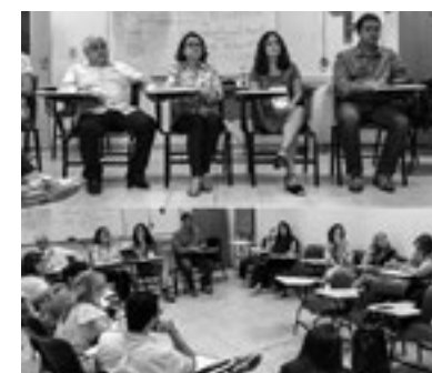
Participação nas discussões em torno dos ACE e ACS durante os trabalhos iniciais do Abrascão 2017, realizado em Natal no mês de Maio (Foto: Arquivo do Cosems-RN).