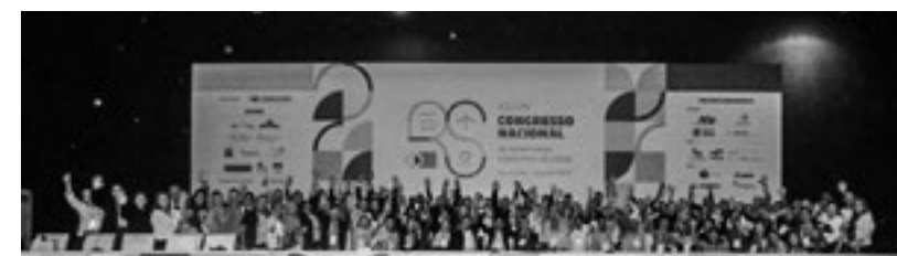
Apoio na participação dos gestores durante o XXXIII Congresso Nacional de Secretarias Municipais de Saúde, realizado em Brasília/DF, entre 12 e 15 de Julho (Foto: Arquivo do Cosems-RN).