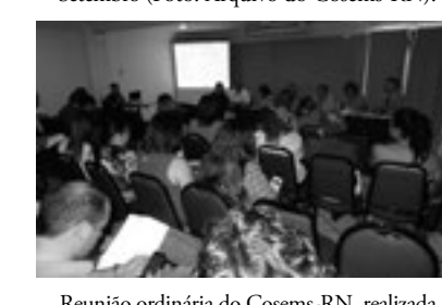
Reunião ordinária do Cosems-RN, realizada em 14 de Novembro, em Natal (Foto: Arquivo do Cosems-RN).