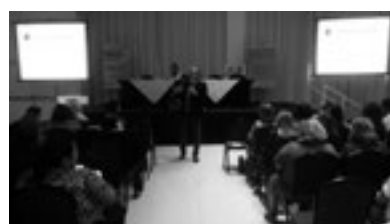
Presença do presidente do Conselho Nacional de Secretarias Municipais de Saúde (Conasems), Mauro Guimarães Junqueira, durante acolhimento anual dos secretários municipais de saúde, realizado em 21 de Fevereiro, em Natal (Foto: Arquivo do Cosems-RN).