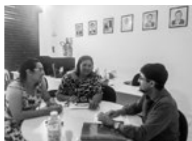
Atendimento aos gestores municipais na sede do Cosems-RN, em Natal (Foto: Arquivo do Cosems-RN).

em várias discussões, mesas, representações e eventos; reafirmando, sempre, o compromisso da Instituição em fortalecer o SUS e os demais gestores norte-rio-grandenses.