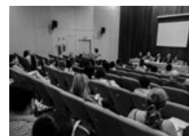
Cosems-RN discute PICs e PEPICS em encontro que antecedeu o I Congresso nacional de PICs e o III Encontro Nordestino de PICs, ambos realizados em Natal, entre os dias 12 e 14 de Outubro (Foto: Arquivo do Cosems-RN).