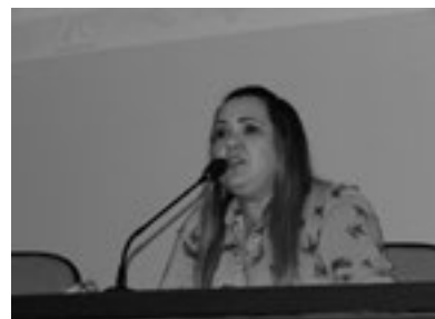
Participação nas discussões do Seminário de Avaliação do PMAQ no RN, realizado em 30 de março, em Natal.