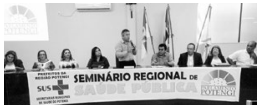
Participação no 4º Seminário de Saúde Pública do Potengi, realizado no município de São Paulo do Potengi, em 17 de Fevereiro.