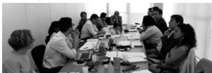
Representando o Conasems, Cosems discutiu atualização da Renome durante audiência realizada em 05 de abril, em Brasília/DF (Foto: Arquivo do Cosems-RN).