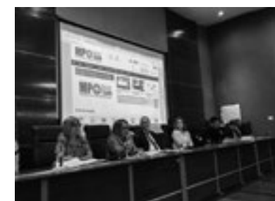
Encerramento do Projeto Nascir com Dignidade, realizado em 29 de Maio, em Natal.