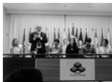
Audiência sobre regionalização da saúde, realizada em 06 de Fevereiro, na sede da Associação dos Municípios do Seridó Oriental (AMSO), em Currais Novos (Foto: Arquivo do Cosems-RN).