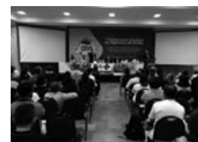
Participação na 1ª Conferência Estadual de Vigilância em Saúde, realizada em Natal, entre os dias 23 e 25 de Outubro (Foto: Arquivo do Cosems-RN).