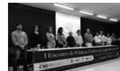
Com presença do Cosems, CRO realiza I Encontro de Políticas Públicas de Saúde Bucal do RN, em 10 de agosto, em Natal.