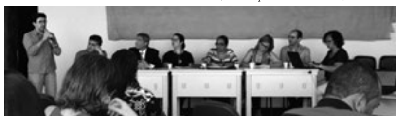
Participação nas discussões sobre Atenção Básica no RN, durante reunião do Conselho Estadual de Saúde (CES), em 05 de maio.