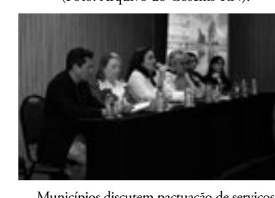
Municípios discutem pactuação de serviços no Rio Grande do Norte durante fórum da PPI, realizado em Natal, no dia 25 de Outubro (Foto: Arquivo do Cosems-RN).