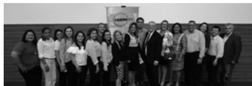
Posse da nova diretoria do Cosems-RN, realizada em Natal, no dia 19 de abril (Foto: Arquivo do Cosems-RN).