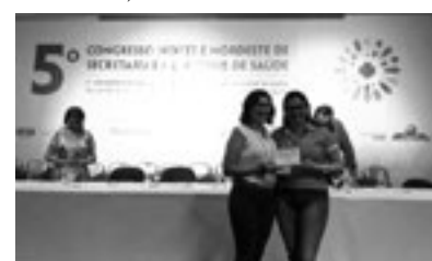
Experiências exitosas de São Paulo do Potengi e Major Sales foram premiadas durante o 5º Congresso Norte Nordeste de Secretarias Municipais de Saúde, realizado em Porto Seguro/BA, entre 03 e 06 de Maio (Foto: Arquivo do Cosems-RN).