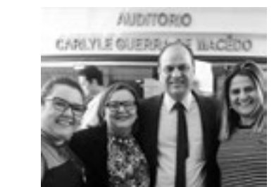
Participação nos encontros da Comissão Intergestores Tripartite (CIT), em Brasília (Foto: Arquivo do Cosems-RN).