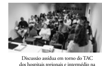
Discussão assídua em torno do TAC dos hospitais regionais e intermédio na construção de propostas viáveis para mudança de perfil dos hospitais afetados.