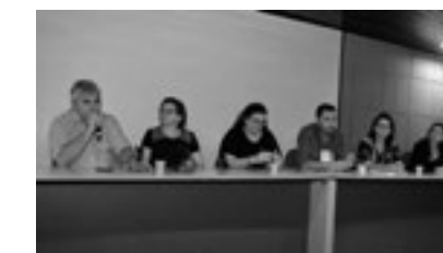
Participação nas discussões da 1ª Conferência Regional de Vigilância em Saúde da Região Metropolitana de Natal, realizada em 26 de Setembro.